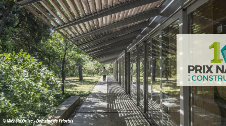
© Michèle Orliac - Domaine de l'Hortus