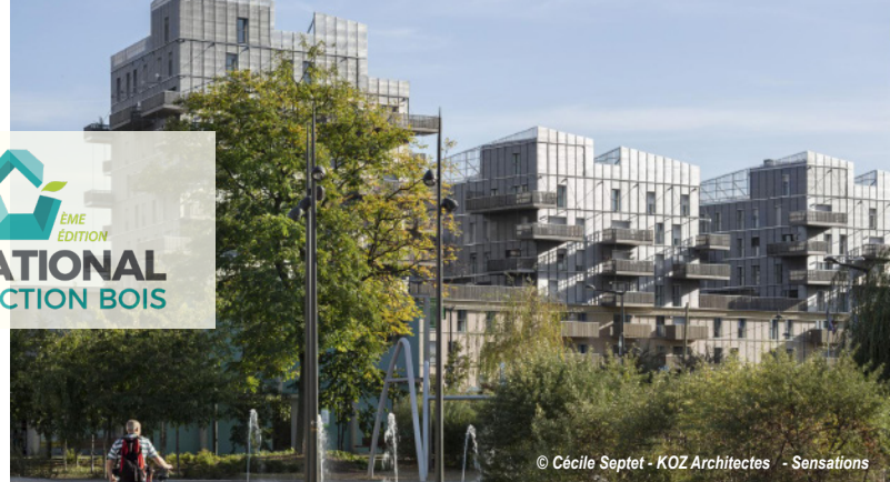
© Cécile Septet - KOZ Architectes - Sensations